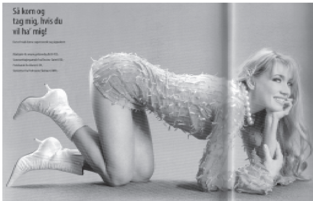
Figur 1. Udsnit af mode- og tøjserie og eksempel på kategori 1.