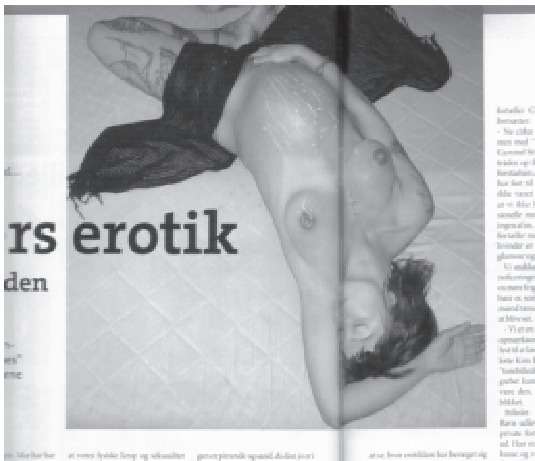
Figur 4. Billede fra udstillingen "Making Eyes" og eksempel på kategori 4.