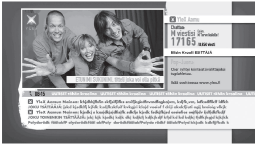
YleX radiokanals Cross Media-version för YLE Extra TV-kanalen