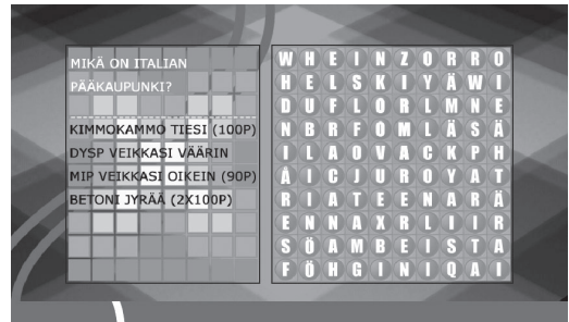
Korsord som TV-spel via SMS

YLEs TV-spel är numera i första hand Stand Alone datorspel på TV, och sändningstiden är sent på kvällen eller på natten.