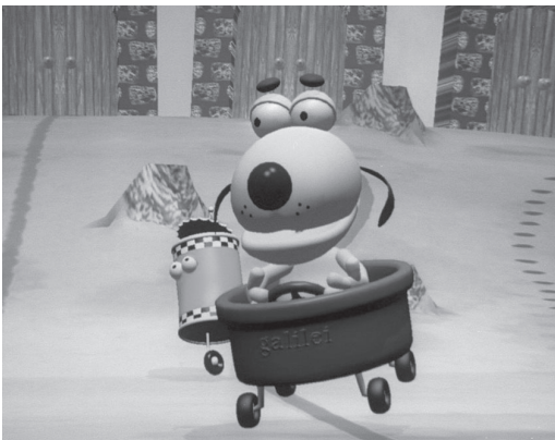
Galilei och de försvunna leksakerna

På 90-talet försökte TV-producenterna hitta nya idéer för interaktiv TV. Avdelningen för barn- och ungdomsprogram beslöt att generera ett datorspel på TV där barn kunde utveckla sin problemlösnings- och slutledningsförmåga i sin upplevelsevärld utan att hela tiden tänka på inläring.