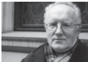
Redaktør i Aftenposten