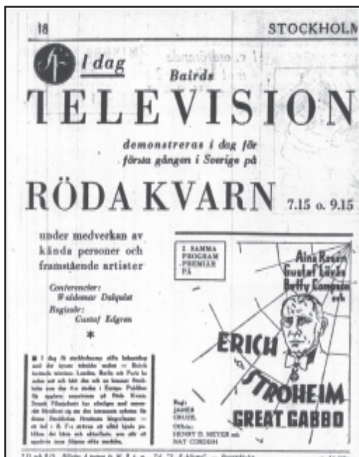
Stockholms-Tidningen 8 december 1930

Det klangfulla ljudet fann inte heller nåd i denna skribents öron, som menade att de svaga och diffusa dimfigurerna borde ha haft ett mera diskret ackompanjement. Journalisten misstänkte att det höga ljudets lovliga avsikt var att överrösta motorens dån. Dessutom ansågs det som ett felgrepp att framföra en violinist på den fluktuerande skärmen. De snabba fram- och återgående rörelserna blev ett sammelsurium på skärmen. "Men den saken är lätt hjälpt, det går ju an att spela ett långsammare stycke." Trots alla brister och missöden menade Rx att föreläsningen måste betecknas som både lärorik och roande – i synnerhet det senare. "Premiärpubliken var tydligt intresserad och applåderade villigt, även när ingenting alls fanns att se på skärmen." Den nedlåtenhet som inte sällan präglade inställningen till TV-tittande fick här ett tidigt uttryck.