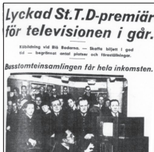
Stockholms-Tidningen 12/12 1935

Om Dagens Nyheter trodde på beteckningen ”synradion” så tippade Stockholms-Tidningen på ”bildradion”. Tidningen menade att man måste ha klart för sig att det ännu återstod en relativt lång tids arbete innan det fanns prisbilliga och för alla användbara bildradiomottagare.