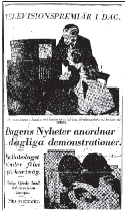
Dagens Nyheter 11/12 1935 s 1

Varje föreställning varade i en kvart, vilket Dagens Nyheter ansåg som fullt tillräckligt för att man skulle få en klar uppfattning av hur långt tekniken hunnit i "televisionens fantasieggande värld". På grund av den lilla mottagarskärmen kunde endast ett fåtal "åskådare och åhörare" tas emot vid varje föreställning ( Dagens Nyheter 11/12 1935). Antalet var begränsat till ett tjugotal, vilket man kan tycka vara en stor publik för en bildskärm mindre än ett A4-blad.