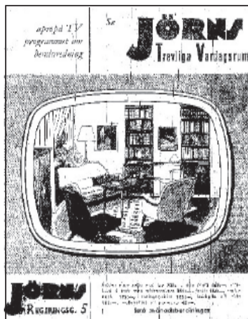
Dagens Nyheter 20/5 1954, s 13

Stockholms-Tidningen kunde också berätta att amerikanerna höll på att flytta ut sina svartvita apparater till köket och färgapparaterna in i vardagsrum-