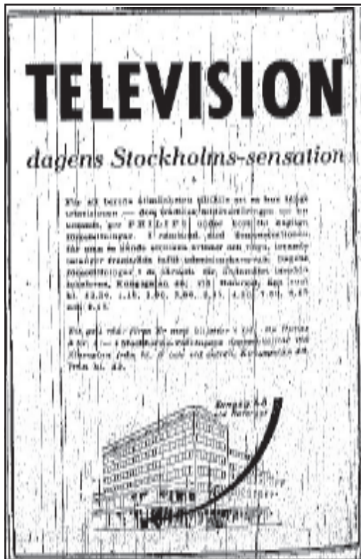
Svenska Dagbladet 14/11 1938, s 12

ciationer såväl till mångfald som till viss folklig anonymitet. Innehållet i studiosändningarna uppmärksammades på ett annat sätt än vad som var fallet 1930. Däremot recenserades inte de olika programdagarna. Den allmänna tonen när det gällde innehållet var utomordentligt positiv och då i första hand att nya förmågor fick chansen att uppträda.