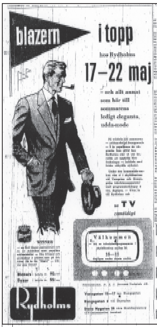
Dagens Nyheter 16/5 1954, s 12

I klädesaffären Rydholms centralt belägna butiker kunde man se televisionsprogrammen i skyltfönstren. ”Titta in till Rydholms och se TV samtidigt”.