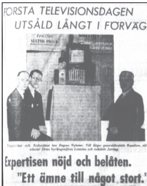
Dagens Nyheter 12/12 1935