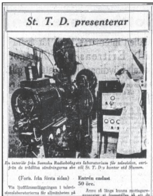
Stockholms-Tidningen 11/12 1935, s 4

laboratoriebilar och är redan inom loppet av en minut klar för utsändning pr television. Genom en s.k. analyseringsanordning och fotoceller förvandlas bilder och ljud i sändaren till elektriska impulser, som trådlöst överförs till mottagaren, kallad Radiola Televi. ( Stockholms-Tidningen 11/12 1935)