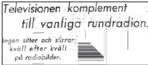
Dagens Nyheter 20/12 1935, s 6

17, 1937). De redan befintliga så kallade aktualitetsbiograferna hade inte utgjort någon direkt konkurrens till de vanliga biograferna men kunde bli det när televisionsepoken inleddes. 12