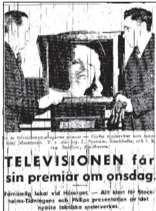
Stockholms-Tidningen 6/11 1938, s 1

Visningarna skedde på Kungsgatan vid Hötorget i Stockholms centrum i en lokal en trappa upp dit en rulltrappa, noga poängterat i tidningsmaterialet, förde publiken. Rulltrappan var också den en teknisk modernitet som nått Stockholm under 1930-talet och som måhända bidrog till uppfattningen om den blaserade samtiden fast då förstas i hård konkurrens med flyget.