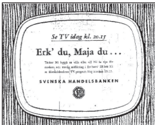
Dagens Nyheter 19/5 1954, s 13

Varuhuset NK, tillika sponsor av premiärdagens mannekänguppvisning, erbjöd televisionsparty i Lunchrummet, där TV-programmen kunde ses i AGA-mottagare. På tredje våningen vid barnvagnsavdelningen kunde man se TV i en Philipsapparat och på Radioavdelningen på undre bottenvåningen kunde TV ses i samtliga de mottagarapparater som NK saluförde. I ett P.S. i annonsen berättar man att NK redan sålt ett flertal TV-mottagare: framsynt folk har redan börjat köpa TV.